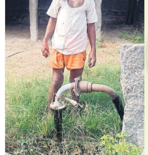
కౌలుదారు చట్టంతో పంచాయతీల్లో..

గతంలో తండ్రి నుంచి కొడుకు పేరున భూమి మార్చాలన్నప్పుడు పట్టూరిల పెత్తనంతో ఇబ్బందులు పడాల్సి వచ్చేది. పనులు కాక పరేషాన్ అవ్వాలి వచ్చేది. కానీ, స్వరాష్ట్రంలో సీఎం కేసీఆర్ ప్రభుత్వంలో ఆ భాదలు తొలిగిపోయాయి. ధరణి పోర్టల్ తీసుకొచ్చి భూ సమస్యలకు చెట్ పెట్టారు. రైతు పేరున 10 గంటల భూమి భద్రంగా ఉండేది. అలాంటిది కాదని కాంగ్రెస్ పక్షం ధరణిని రద్దు చేస్తామంటున్నారని. ధరణిని తీసేస్తే మునుపటి రోజుల్లో స్థాయి. మళ్లీ భూమి రిజిస్ట్రేషన్ కోసం దళారీల చుట్టూ తిరగాల్సి వస్తుంది. కాబట్టి ధరణిని రద్దు చేస్తామంటున్న కాంగ్రెస్ పక్షం అధికారం ఇవ్వద్దు.