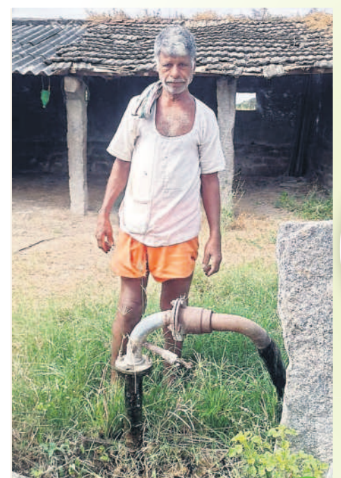
కౌలుదారు చట్టంతో పంచాయతీల్లో..

యాదాద్రి భువనగిరి, నవంబర్ 23 (నమస్తే తెలంగాణ) : కాంగ్రెస్ పార్టీ అధికారంలోకి వస్తే కౌలుదారు చట్టం తీసుకొస్తాం ఇదీ సీఎల్పీ నేత మల్లె భట్టి విక్రమార్క స్వయంగా చేసిన కామెంట్. ఆయన చేసిన వ్యాఖ్యలు ఇప్పుడు రైతుల గుండెల్లో రైళ్ల పరుగెత్తిస్తున్నాయి. ఈ చట్టం తీసుకొస్తే రైతులకు ఉదరీ గతి అని ఆందోళన చెందుతున్నారు. దాని ప్రకారం రైతులు తమ భూమిని కౌలుకు ఇస్తే అదే ప్రభుత్వ రికార్డుల్లో నమోదుచేయాలి. దీనితో భూయజమాన్య హక్కులకు ఎవరు వచ్చే ప్రమాదం వస్తుందని గుంటులు పడుతున్నారు. అంతేకాకుండా న్యాయస్థానంలో నిలబెట్టే పరిస్థితి ప్రమాదం ఉంది. దీంతో పల్లెల్లో కౌలు చిమ్మ రాజకీయాలతో పాటు ఊర్లో ప్రశాంతత దెబ్బతింటుంది.