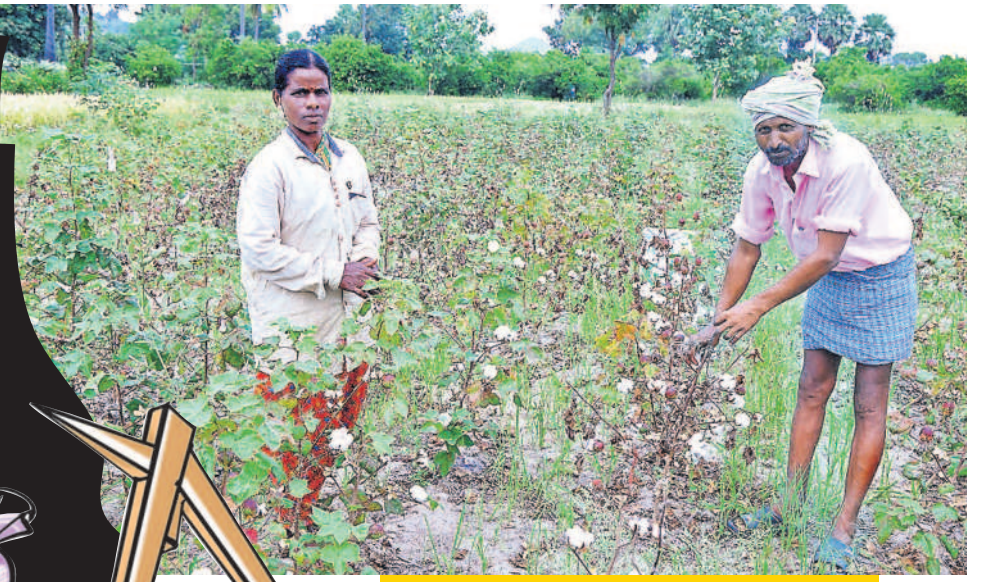
రేవంత్ రెడ్డి మాటలు నమ్మితే అత్తనాత్మలే..

ముళ్లీ మోటర్లు కాలుడు.. ట్రాన్స్ఫార్మర్లు పేలుడే.. కాంగ్రెస్ పాలనలో పాలం వద్దే రాత్రింతా పడిపోతుంది కొత్త మోటర్లతో ఒక్కో రైతుకు లక్షకు పైగా ఖర్చు