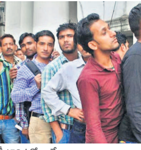
ప్రతి లక్ష మందికి 153 ఉద్యోగాలే దేశంలోని అర్హులైన ప్రతి లక్ష మందికి గడిచిన పదేండ్లలో కేంద్రంలోని బీజేపీ సర్కారు సగటున 153 ప్రభుత్వ ఉద్యోగాలను ఇచ్చింది. దేశంలో నిరుద్యోగిత రేటు ప్రస్తుతం 10.1 శాతంగా ఉన్నది.

వాడి లక్ష్మయ్య: గీ మాటన్నోనికి ఏమన్న తల్పాయ గిట్ల ఖరా ఖైందలరా.. (అందరి నవ్వులు) లేకపోతే ఏదే! ఎప్పుసం మంచిగండాలన్న కేసీఆర్ సార్ 24 గంటల కరెంటియ్యవట్టి. ఇప్పుడు గాడెడో అచ్చి మూడు గంటలు మన్నయతదంటే మన ఇనుకుంటు కూసుంటమా.. ఏం చెయ్యాలన్నీ గది బరా బర్ చెయ్యాలే.