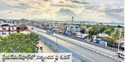
స్టేషన్ ఘనపూర్ లో నిర్మించిన పై ఓవర్

డబుల్ బెడ్రూం ఇంట్లు స్టేషన్ ఘనపూర్ణం మండలం.. రాఘవాపూర్ లో 40 డబుల్ బెడ్రూం ఇంట్లను నిర్మించి లబ్ధిదారులకు అందజేశారు. కొత్తపల్లిలో 30 డబుల్ బెడ్రూం ఇండ్లను నిర్మించి అర్ధిదారులను ఎంపిక చేశారు. పల్లగుట్టలో 30 ఇండ్ల నిర్మాణం పూర్తయ్యింది. పంటిపేడి సిద్ధంగా ఉన్నాయి. సముద్రాలలో 40, పాపూర్ లో 40 డబుల్ బెడ్రూం ఇండ్ల నిర్మాణం కొనసాగుతున్నది. స్టేషన్ ఘనపూర్ మండలానికి 150, చిల్కూరుకు 30, జాఫర్ గడ్డుకు 50, తిమ్మంపేటకు 25 డబుల్ బెడ్రూం ఇండ్ల మంజూరయ్యాయి.