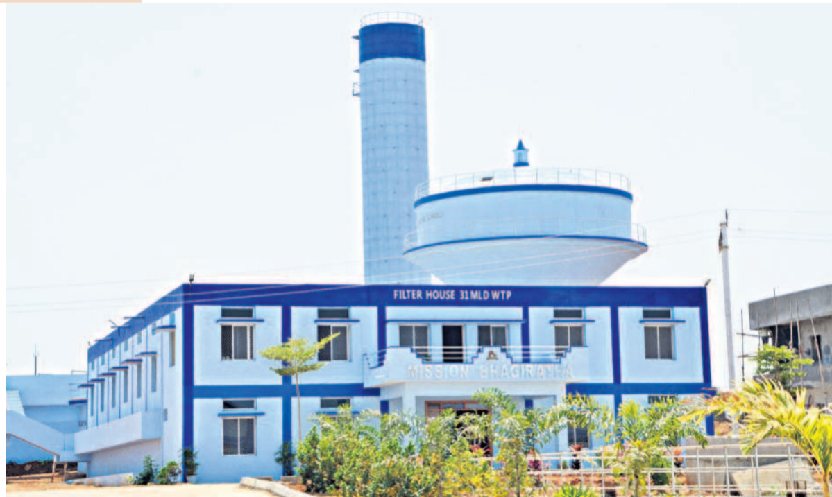
తెలంగాణ వచ్చాక ఉప్పాంగే నల్లగొండ జిల్లా ఫైర్ డ్రెడ్ మీద విరగడైంది. ఫైర్ డ్రెడ్ పోరులో భాగంగా నాంపల్లి మండలంలోని ఎన్డబ్ల్యూ లింగోటం గ్రామంలో 2018లో బీఆర్ఎస్ ప్రభుత్వం మిషన్ బీగ్ రిటర్న వాటర్ ఫ్యాంట్ ఏర్పాటు చేసింది. రూ.25.50 కోట్లతో దీనిని నిర్మించారు. శుద్ధిచేసిన జలాలుతో మునుగోడువాసుల గొంతు తడిపారు. ఈ ఫ్యాంట్ నుంచి మునుగోడు, దేవరకొండ నియోజకవర్గాలు, పోచంపల్లి మున్సిపాలిటీ, మొత్తంగా 301 గ్రామాలకు శుద్ధజలాలు సరఫరా అవుతున్నాయి.