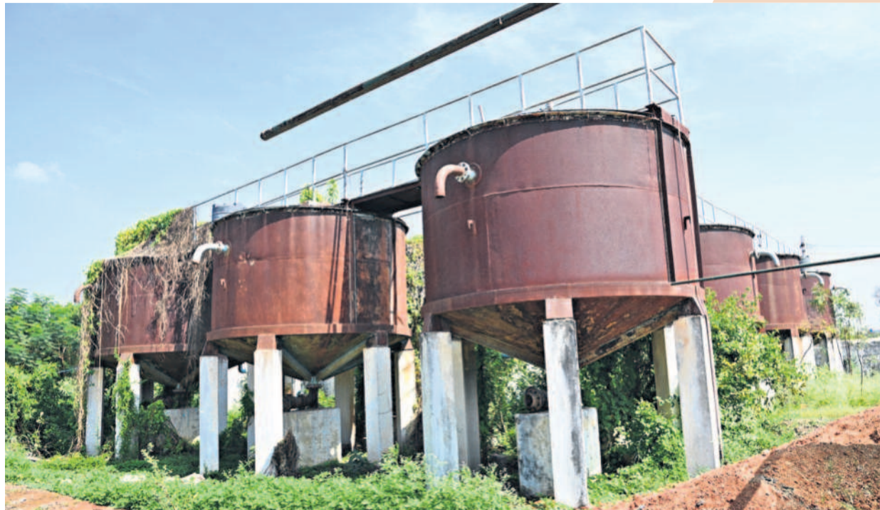
ఫైర్ డ్రెడ్ రక్తిని నల్లగొండ జిల్లాలో కొన్ని తరాలను కోలుకోలేని దెబ్బతీసింది. గుక్కెడు మంచినీళ్లు ఇచ్చి మా బతుకులు కాపాడండి అని ఎంత మొత్తుకున్నా నాటి రాతి గుండెలు కర్రలేదా. కంటిమీద పువ్వుగా మునుగోడులో 1994లో రూ.18 లక్షలతో డిప్లోమెంట్ ఫ్యాంటీను ఏర్పాటు చేసినది అప్పటి ప్రభుత్వం. కానీ, మునుగోడు గోడు తీలంది కాదు. నెలలు తిరిగేసరికి ఇనుప ట్యాంకులు బిలు వట్టిపోయాయి. మునుగోడు, చుట్టుపక్కల గ్రామాల ఫైర్ డ్రెడ్ కష్టాలు మరో రెండు దశాబ్దాలు కొనసాగాయి.