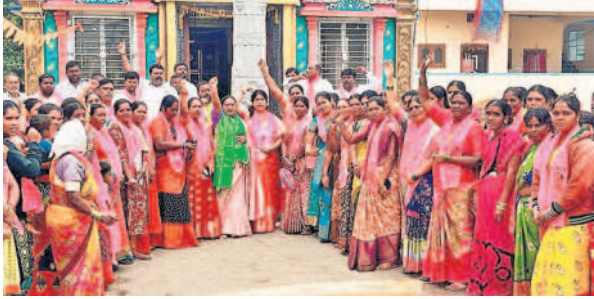
మేడ్చల్ మండలంలోని రాజబొల్లారం గ్రామంలో ప్రచారంలో పాల్గొన్న మహిళా నేతలు