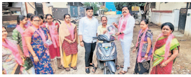
మేడ్చల్లో బీఆర్ఎస్ కు ఓటు వేయాలని కోరుతున్న బీఆర్ఎస్ నేత