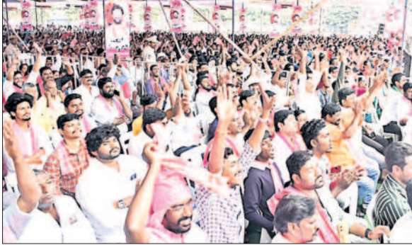
ప్రజా ఆశీర్వాద సభకు భారీగా హాజరైన ప్రజలు