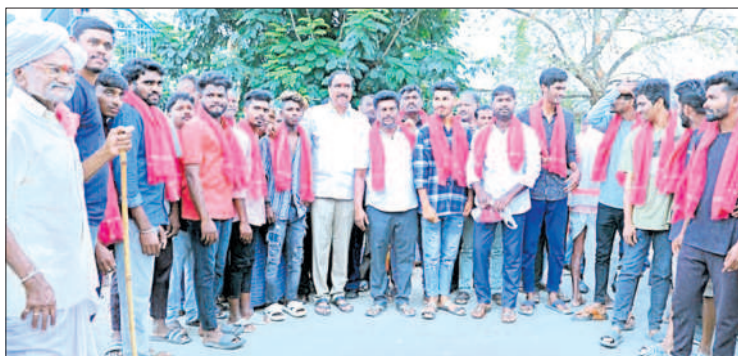
పార్టీలో చేరిన యువకులతో ఎమ్మెల్యే సంజయ్ కుమార్