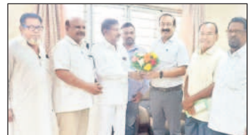
బసవరాజేంద్రకు పుష్పగుచ్ఛాన్ని అందిస్తున్న సీనియర్ సిటిజన్స్ అసోసియేషన్ ప్రతినిధులు

ఓటు హక్కును సద్వినియోగం చేసుకోవాలి కేంద్ర ఎన్నికల పరిశీలకుడు బసవరాజేంద్ర