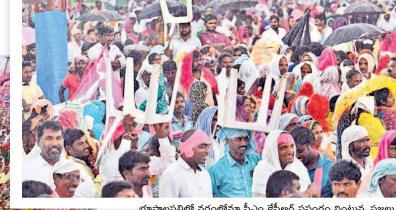
భూపాలపల్లిలో వర్షంలోనూ సీఎం కేసీఆర్ ప్రసంగం వింటున్న ప్రజలు