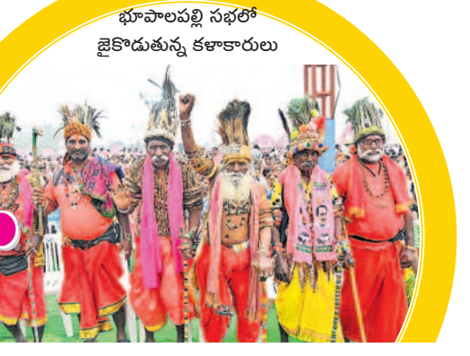
భూపాలపల్లి సభలో జైకొడుతున్న కళాకారులు