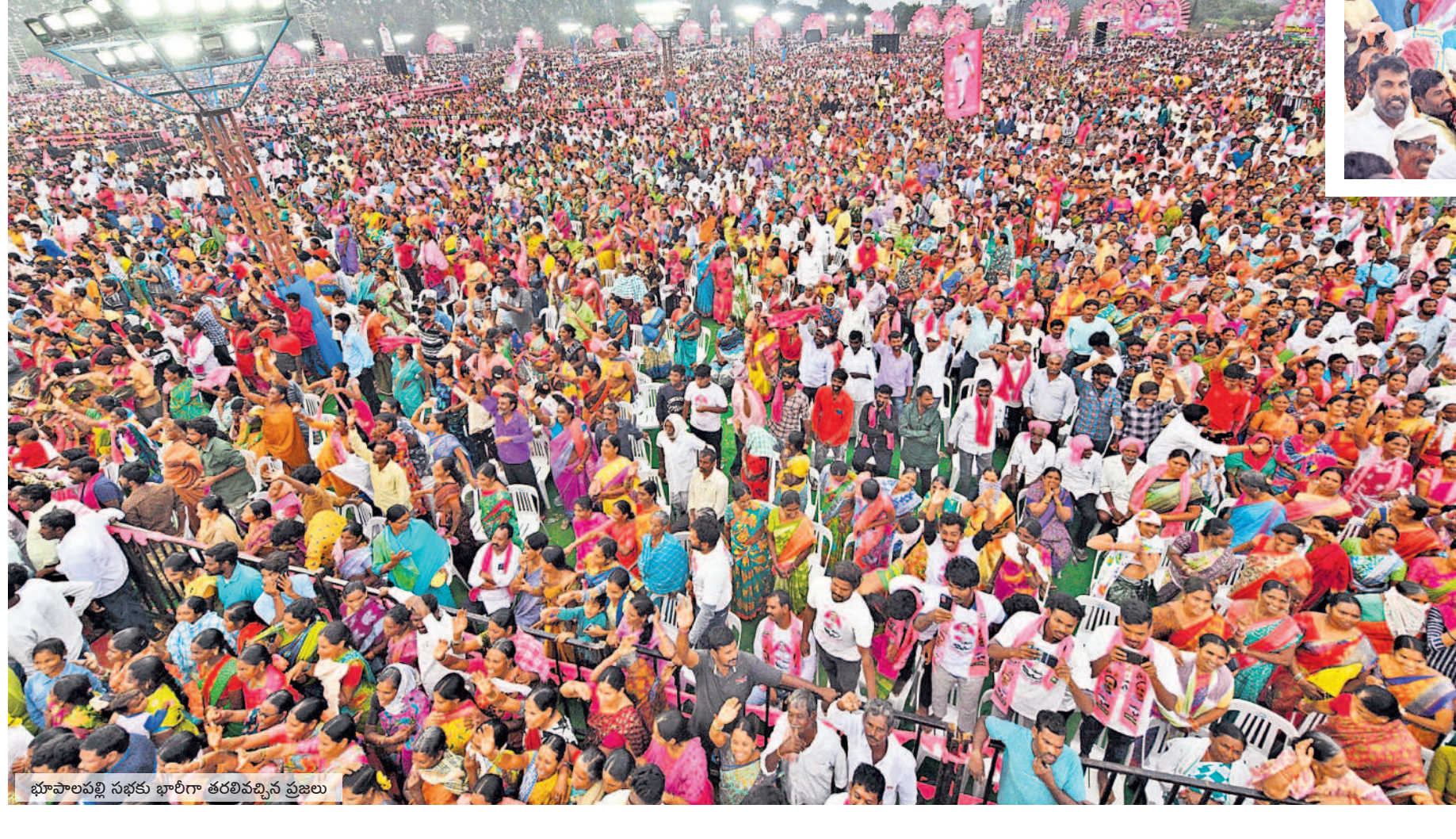
భూపాలపల్లి సభకు భారీగా తరలివచ్చిన ప్రజలు