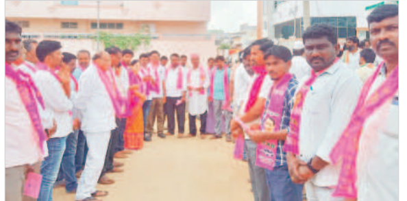
అత్యుక్తంలో ప్రచారం నిర్వహిస్తున్న బీఆర్ఎస్ నాయకులు

నర్స, నవంబర్ 24: మండలంలోని కల్వాల, నర్స, పెద్దకడూర్, లంకాల, యాంకి, కుమార్లింగంపల్లి, ఉండె