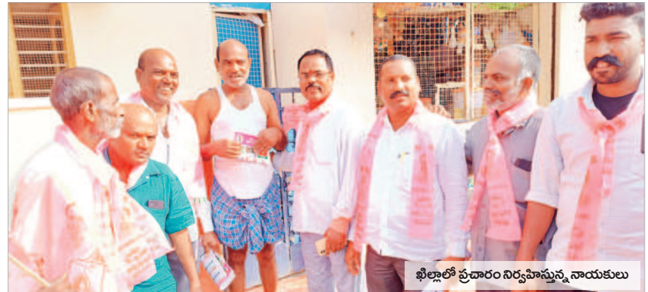
ఖిల్లాలో ప్రచారం నిర్వహిస్తున్న నాయకులు