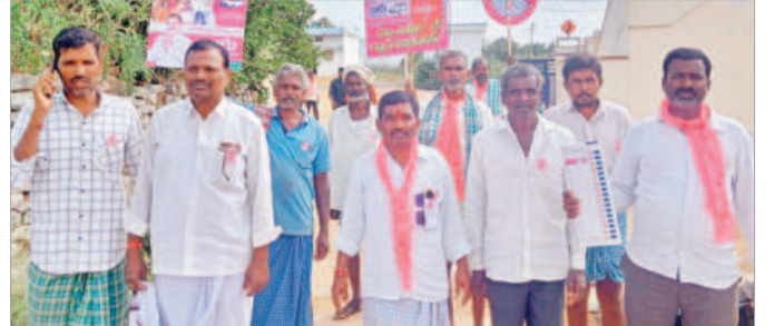
అప్పారెడ్డిపల్లిలో ప్రచారంలో పాల్గొన్న బీఆర్ఎస్ నాయకులు

అందించారన్నారు. ఖిల్లా పుణపురం, పెద్దమందడి, భూత్పూర్, అడ్డాకుల మండలాలకు సాగునీటిని అందించారని పేర్కొన్నారు. ధరణితో రావడంతో రైతులకు పారదర్శకత పెరిగింది, డిజిటల్ రికార్డులను తీసుకురావడంలో కేసీఆర్ ప్రభుత్వం చేసిన కృషి రైతులకు మేలు జరిగిందన్నారు. గతంలో వ్యవసాయ రంగాన్ని ఆగమంగా చేసిన కాంగ్రెస్ నాయకులు మళ్లీ ఎం ముఖం పెట్టుకొని ఓట్లు అడగడానికి వస్తున్నారని విమర్శించారు. దండగ అన్న వ్యవసాయాన్ని పండుగ చేసిన దమ్మున నాయకుడు మంత్రి నిరంజన్ రెడ్డి అని.. కారుగుర్తుకు ఓటు వేసి భారీ మెజార్టీతో గెలిపించాలన్నారు. కార్యక్రమంలో నాయకులు, ప్రజాప్రతినిధులు పాల్గొన్నారు.