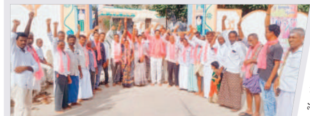
మోజర్ల గ్రామంలో ప్రచారం చేస్తున్న నాయకులు