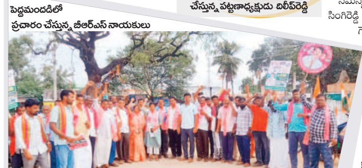
పెద్దమందడిలో ప్రచారం చేస్తున్న బీఆర్ఎస్ నాయకులు