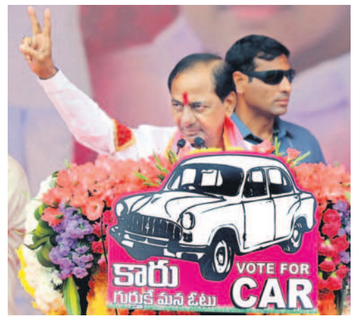
జై కేసీఆర్.. జై తెలంగాణ మంచీర్యాల ప్రజా ఆశీర్వాద సభకు తరలివచ్చిన అశోక్ జనవాహినీని ఉద్దేశించి ప్రసంగిస్తున్న సీఎం కేసీఆర్ ← నినాదాలు చేస్తున్న యువకులు