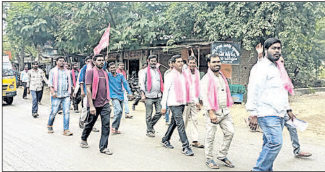
కౌటాల: కౌటాల మండల కేంద్రంలో ర్యాలీ తీస్తున్న బీఆర్ఎస్ నాయకులు