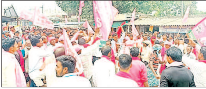
చింతలమానేపల్లి : రవీంద్రనగర్-1 మార్కెట్ లో ర్యాలీ తీస్తున్న బీఆర్ఎస్ నాయకులు