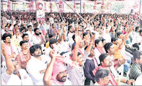
ప్రజా ఆశీర్వాద సభకు భారీగా హాజరైన ప్రజలు