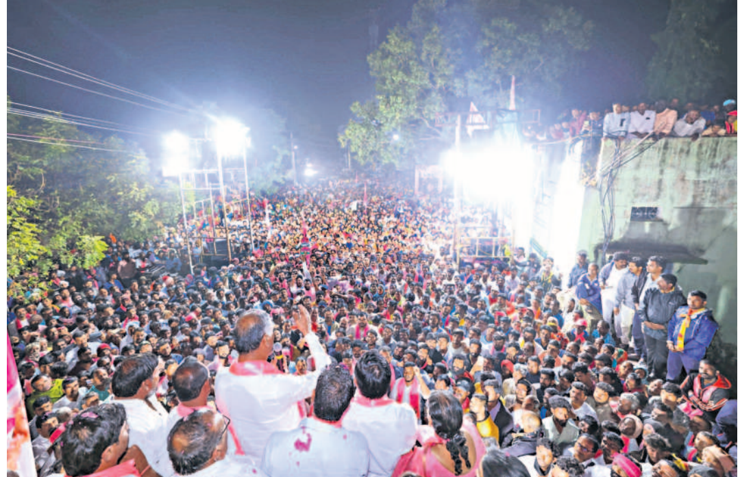
సిద్దిపేట జిల్లా నంగూరు మండల కేంద్రంలో నిర్వహించిన రోడ్ డివైజన్ మాట్లాడుతున్న మంత్రి హరికే రావు, పెద్ద సంఖ్యలో హాజరైన ప్రజలు

“ కట్ట వేస్తే వచ్చే కరెంటే కావాలా? కటిక చీకటి కర్ణాటక లాంటి బతుకు కావాలా? ప్రజలే తెల్లారు - మంత్రి హరికే రావు