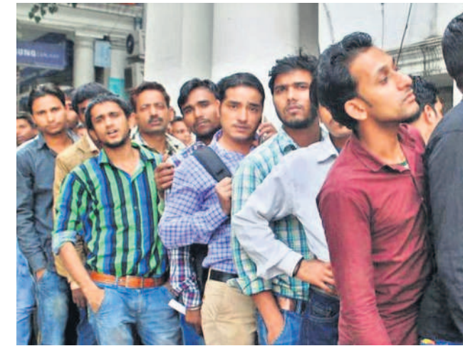
ప్రతి లక్ష మందికి 153 ఉద్యోగాలే దేశంలోని అర్హులైన ప్రతి లక్ష మందికి గడిచిన పదేండ్లలో కేంద్రంలోని బీజేపీ సర్కారు సగటున 153 ప్రభుత్వ ఉద్యోగాలను ఇచ్చింది. దేశంలో నిరుద్యోగిత రేటు ప్రస్తుతం 10.1 శాతంగా ఉన్నది.

అనుముల ఆదిరెడ్డి: అవ్.. అంతెంతో మన కాలై మోటర్ వైండింగ్ ఫాల్సుల కరెంటి మోటర్లు మండెలు వడి ఉండకపో వునా! వైండింగ్ పిల్లగాడు పొద్దుమాకుల పనిచేసినా.. మోటర్లు అప్సేట్ ఉంటుండే. ఇప్పుడు ఆ ఫాపీ బండ్ అయి పాయె. గంతెందుకు, రాత్రి కరెంటి పెట్టవోయి నచ్చిపోయి నోళ్ల ఎంతమందిని చూసినా.. రాత్రయితే ఇల్లు ఇడ్డిపెట్టి పాలలనే ఉండుం. సుట్టకునే పోయినా.. పోకోపతిమి.