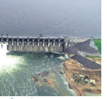
దగాలలో పాలనలో తగబడిపోయిన రైతు బతుకులకు సాక్ష్యమిది!