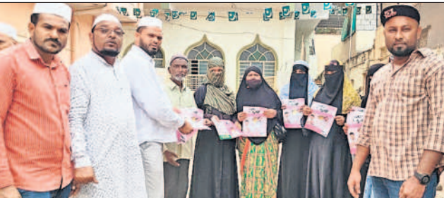
వెంకటాపురం డివిజన్ ఇందిరానగర్ లో ప్రచారం చేస్తున్న నయద్ మోసిన్