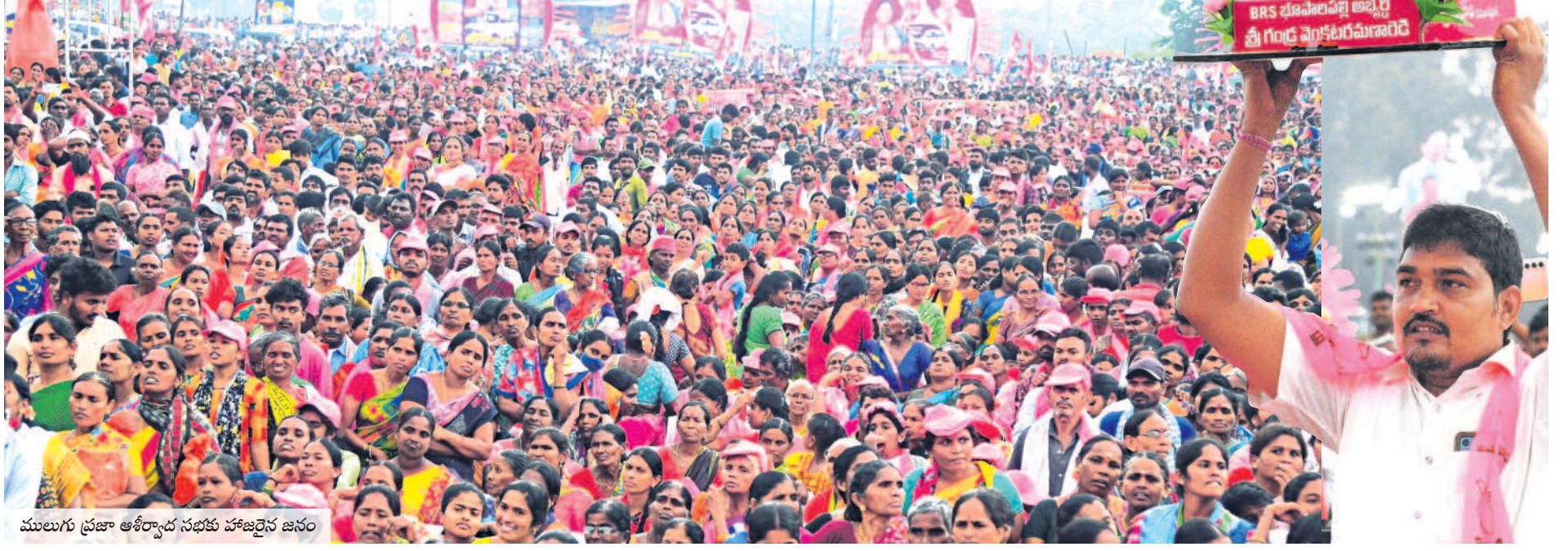
ములుగు ప్రజా ఆశీర్వాద సభకు హాజరైన జనం