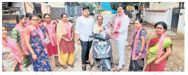
మేడ్చల్లో బీఆర్ఎస్ కు ఓటు వేయాలని కోరుతున్న బీఆర్ఎస్ నేత