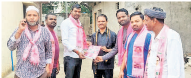
మేడ్చల్లో ప్రచారం చేస్తున్న బీఆర్ఎస్ నాయకులు