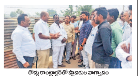
రోడ్డు కాంట్రాక్టర్తో స్థానికుల వాగ్వాదం

రామాయంపేట, నవంబర్ 24 : ఎల్కెఆర్-మెదక్ రోడ్డు పనులపై తమకు ఎలాంటి నోటీసులు ఇవ్వకుండా పనులను చేయడం తగదని బైపాస్ రోడ్డులో భూములను కోల్పోతున్న స్థానిక ప్రజలు రోడ్డుపై నిరసన వ్యక్తం చేసి రోడ్డు పనులను ఆడ్తున్నారు. శుక్రవారం రామాయంపేట పట్టణంలోని గతేడాది కాలంగా మెదక్ ఎల్కెఆర్ రోడ్డు నిర్మించాలని కేంద్ర ప్రభుత్వం సర్వేలను చేపట్టింది. మెదక్ జిల్లా కేంద్రం నుంచి రామాయంపేట కు వచ్చేవరకు ఎక్కడ కూడా బైపాస్ రోడ్డు లేదు. కేవలం రామాయంపేట పట్టణ సమీపంలోనే బైపాస్ రోడ్డు వేసేందుకు అధికారులు నిశ్చయించడంతో గతంలో ఈ విషయమై కోర్టుల వరకు వెళ్లి రోడ్డు పనులు ఆగిపోయాయి. వారం రోజులుగా కాంట్రాక్టర్ మళ్ళీ రోడ్డు పనులు చేపట్టి స్థానికుల భూముల నుంచి బైపాస్ రోడ్డు సర్వేలు చేయడమే గాకుండా భూములు ఉన్న వారికి ఎలాంటి నోటీసులు ఇవ్వకుండా ఏకంగా వారి భూముల్లో రోడ్డుతో పాటు సీమెంట్ పనులు చేపడుతున్నాడు. విషయం తెలుసుకున్న స్థానిక భూ బాధితులు తమ భూముల వద్దకు చేరుకుని పనులను నిలిపేశారు. అక్కడికి చేరుకున్న సంబంధిత కాంట్రాక్టర్తో వాగ్వాదానికి దిగారు. మాకు బైపాస్ వద్దంటూ కోర్టులో పిటిషన్ దాఖలు చేశామని తమకు నోటీసులు గాని సమాచారం ఇచ్చిన తర్వాతనే పనులు మొదలు పెట్టాలని కోర్టు కూడా తీర్పు ఇవ్వడం జరిగిందని మెదక్ రోడ్డుపై గంట పాటు రాస్తాకోకో చేసి నిరసన వ్యక్తం