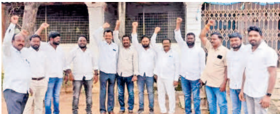
బీఆర్ఎస్ కు మద్దతు తెలుపుతూ నినాదాలు చేస్తున్న సంఘాల నాయకులు