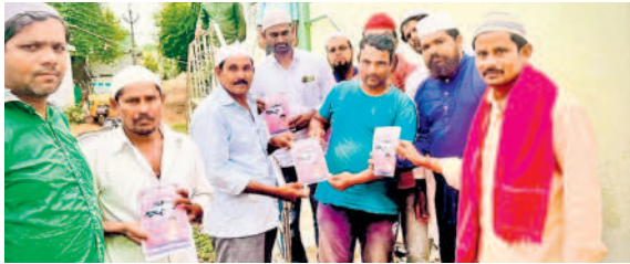
బేతూలులో ప్రచారం చేస్తున్న బీఆర్ఎస్ నాయకులు