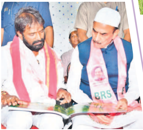
మంత్రి మహమూద్ అలీకి 'మహబూబ్ నగర్ ప్రగతి' పుస్తకం రూపొందించిన పుస్తకాన్ని చూపిస్తున్న మంత్రి శ్రీనివాస్ గౌడ్