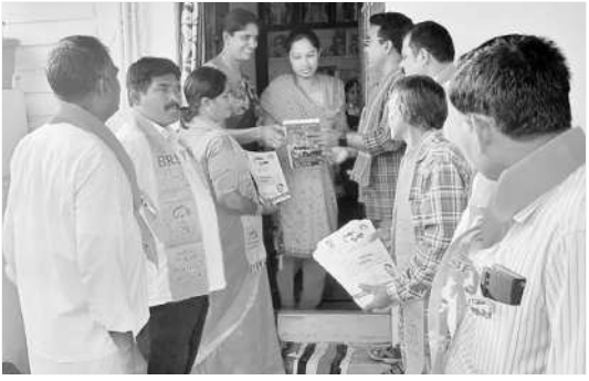
మరికల్లో ప్రచారం చేస్తున్న బీఆర్ఎస్ నాయకులు