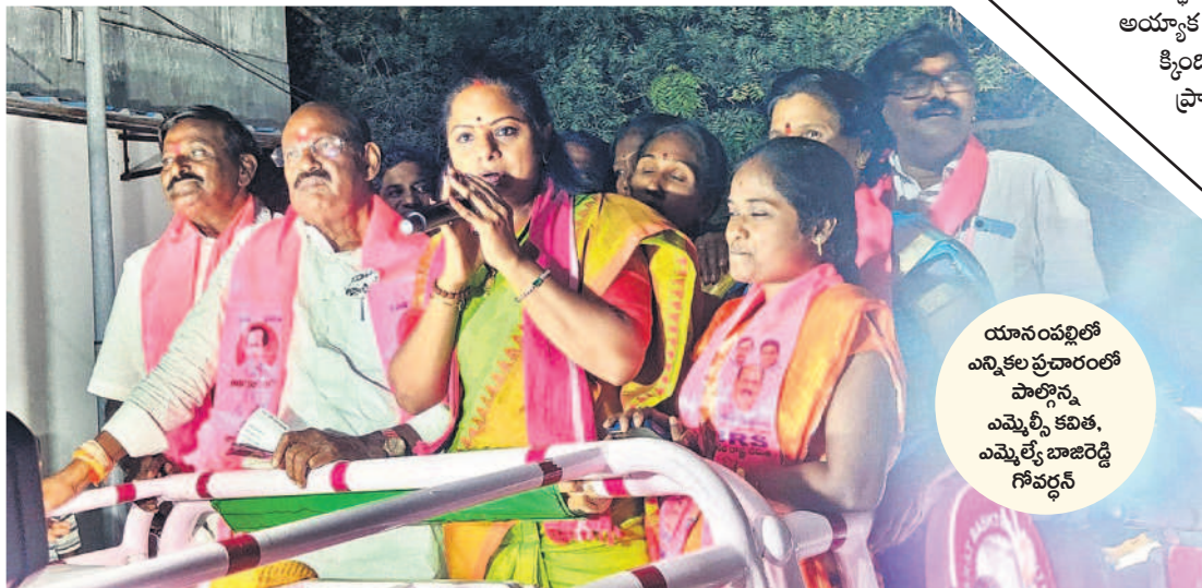
యానంపల్లిలో ఎన్నికల ప్రచారంలో పాల్గొన్న ఎమ్మెల్యే కవిత, ఎమ్మెల్యే బాజరెడ్డి గోవర్ధన్

వ్యవసాయాన్ని ఆగం జేసేందుకు కాంగ్రెస్ కుట్ర