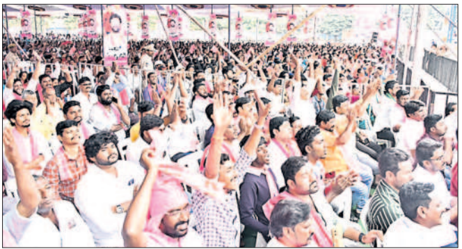
ప్రజా ఆశీర్వాద సభకు భారీగా హాజరైన ప్రజలు