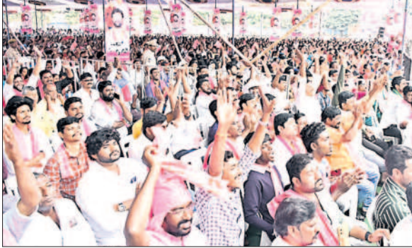
ప్రజా ఆశీర్వాద సభకు భారీగా హాజరైన ప్రజలు