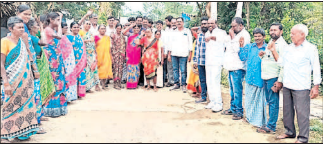
మల్లాపూర్లో దళిత మహిళలతో దళిత ప్రజాప్రతినిధులు, నాయకులు