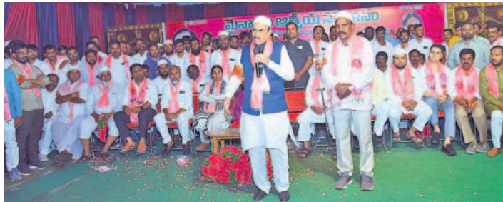
మాట్లాడుతున్న హోంమంత్రి మహమూద్ అలీ, పక్కన ఎమ్మెల్యే కాలె యాదయ్య

మైనార్టీల సంక్షేమానికి కట్టుబడి ఉన్న ప్రజా ప్రభుత్వం బీఆర్ఎస్ హోం మంత్రి మహమూద్ అలీ అన్ని వర్గాలకు సమ ప్రాధాన్యమిస్తున్న సర్కార్ : ఎమ్మెల్యే కాలె యాదయ్య చేపెళ్ల కేజీఆర్ గార్డెన్ లో ముస్లిం మైనార్టీల ఆత్మీయ సమ్మేళనం