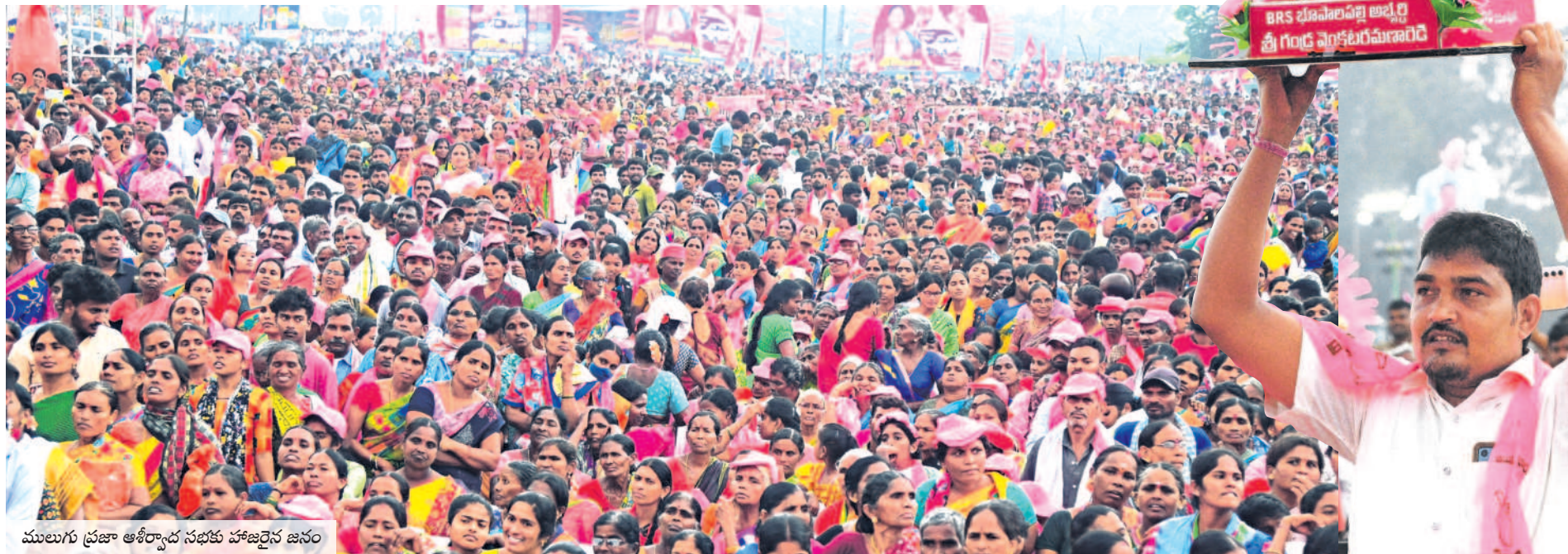
ములుగు ప్రజా ఆశీర్వాద సభకు హాజరైన జనం