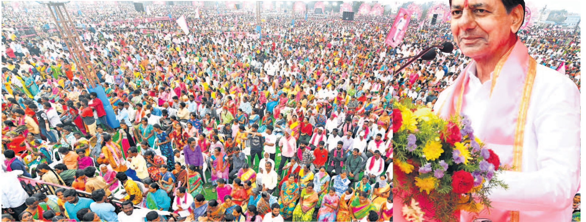
భూపాలపల్లి ప్రజా ఆశీర్వాద సభకు హాజరైన ప్రజలు