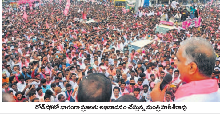
రోడ్ షోలో భాగంగా ప్రజలకు అభివాదనం చేస్తున్న మంత్రి హరీశ్ రావు