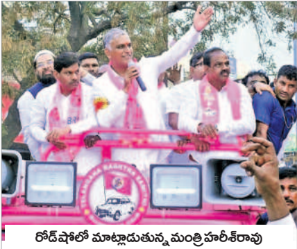
రోడ్ షోలో మాట్లాడుతున్న మంత్రి హరీశ్ రావు