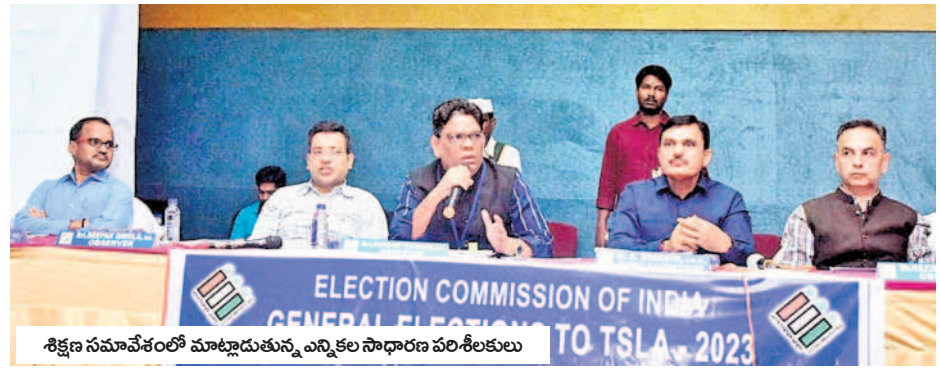
శిక్షణ సమావేశంలో మాట్లాడుతున్న ఎన్నికల సాధారణ పరిశీలకులు