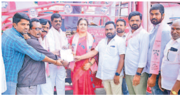
సిద్దిపేట : మంత్రి హరీశ్ రావుకు సంపూర్ణ మద్దతు ప్రకటించిన రంగధాంపల్లి గౌడ సంఘం సభ్యులు