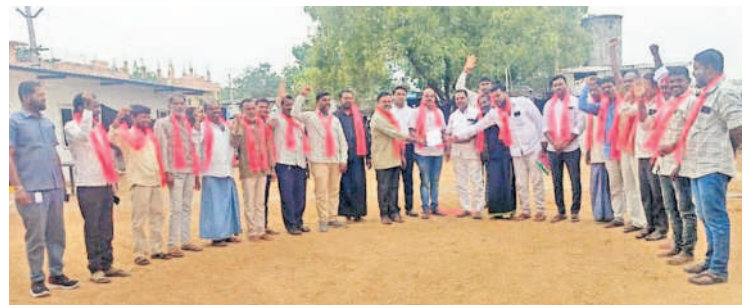
సిద్దిపేట అర్బన్ : మద్దతు పత్రాన్ని అందజేస్తున్న పాన్సాల ఆటో కార్మికులు