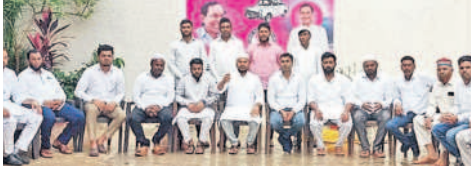
విలేకరుల సమావేశంలో మాట్లాడుతున్న ముస్లిం మైనార్టీ నాయకులు