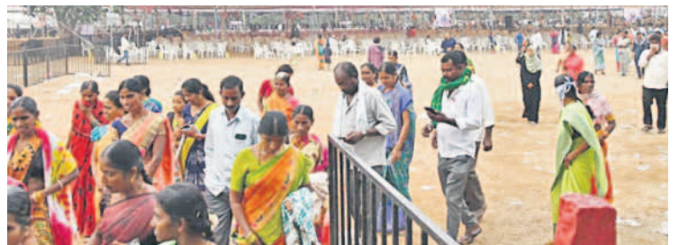
హుస్సాబాద్ కాంగ్రెస్ సభ నుంచి బయటకు వెళ్తున్న ప్రజలు