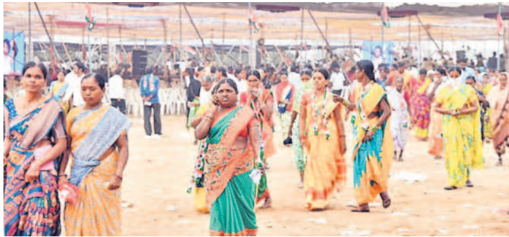
హుస్సాబాద్ కాంగ్రెస్ సభ నుంచి బయటకు వెళ్తున్న మహిళలు

సిద్దిపేట, నవంబర్ 24 (నమస్తే తెలంగాణ ప్రతినిధి) / హుస్సాబాద్ : హుస్సాబాద్లో శుక్రవారం నిర్వహించిన కాంగ్రెస్ పార్టీ సభ అట్టర్ ఫ్లాష్ అయింది. సభకు ఇలా వచ్చామా..? ఇగ పోదాం పదా అంటూ జనం ఒకరి వెంట ఒకరు అంతా తమ గ్రామాలకు తిరుగు ప్రయాణం అయ్యారు. ఏవసీ జనరల్ సెక్రటరీ ప్రియాంకగాంధీ మాట్లాడే సమయానికి సుమారుగా నాలుగైదు వేల మంది మాత్రమే ఉన్నారు. ఆ మందితోనే సభ ముగిసి పింబి వెళ్లిపోయారు. పైగా ఆమె ప్రసంగం ఎవ్వరికీ అర్థం కాక, ఉన్న వారు సైతం గుణుకుంటూ ఉండిపోయారు. హుస్సాబాద్ కాంగ్రెస్ పార్టీ సభ అట్టర్ ఫ్లాష్ కావడంతో ఆ పార్టీ శ్రేణులు నిరాశ గురయ్యారు. వారం రోజులుగా ప్రియాంక సభ సక్సెస్ కోసం గ్రామాల నుంచి జనాన్ని తరలించడానికి చేసిన ప్రయత్నాలు అన్ని విఫలమయ్యాయి. సుమారుగా 30 వేలకు పైగా మందిని లక్ష్యాంగా పెట్టుకొని కేవలం ఐదారు వేల మందితోనే సభ నిర్వహించుకోవాల్సిన పరిస్థితి ఏర్పడింది. ఒక జాతీయ నాయకురాలు సభ