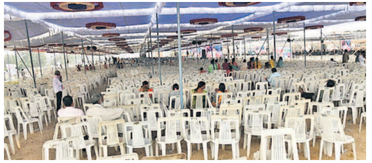
హుస్సాబాద్ కాంగ్రెస్ సభలో ఖాళీగా దర్శనమిస్తున్న కుర్చీలు