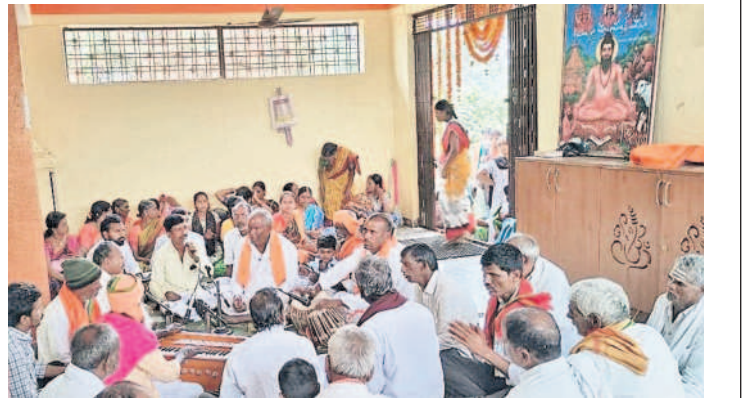
భజన చేస్తున్న భక్త జన బృందం