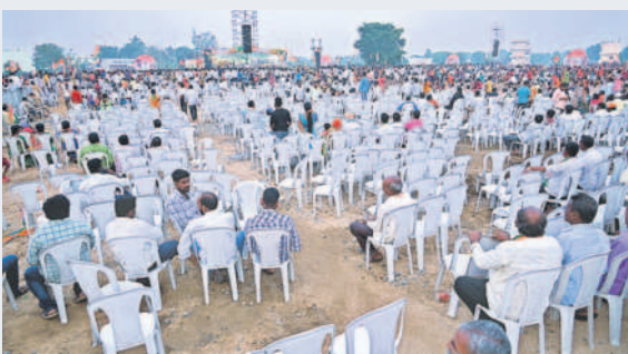
తిరుమలగిరిలో జరిగిన కాంగ్రెస్ సభలో జనం లేక ఖాళీగా కనిపిస్తున్న కుర్చీలు

కాంగ్రెస్ పార్టీ అభ్యర్థులకు మద్దతుగా ఉమ్మడి నల్లగొండ జిల్లాలో టీపీసీసీ అధ్యక్షుడు రేవంత్ రెడ్డి పాల్గొన్న ఎన్నికల ప్రచార సభల్లో ఖాళీ కుర్చీలే దర్శనమిచ్చాయి. ఆయన ప్రసంగించే సమయానికి సభలకు వచ్చిన మెజారిటీ ప్రజలు తిరిగి ఇండ్లకు చేరకున్నారు. పార్టీ నేతలు, కార్యకర్తలు, స్థానికులు ఇలా కొద్ది మందితోనే రేవంత్ రెడ్డి సభలు కొనసాగాయి. రేవంత్ ప్రసంగించే సమయంలో నకిరేకల్, తిరుమలగిరి, యాదగిరి గుట్ట సభా ప్రాంగణాల్లో దర్శనమిచ్చిన ఖాళీ కుర్చీల ఫోటోలు, ఓడియోలు సోషల్ మీడియాలో వైరల్ అవుతున్నాయి. రేవంత్ రెడ్డి మిటింగ్ పెట్టి నెగిటివ్ ప్రచారానికి ఆస్కారం ఇచ్చి నల్లగొండను చర్చ ఆ పార్టీలో మొదలైంది. ఇప్పటికే ఈ నెల 22న నల్లగొండలో ఖాళీ కుర్చీలతో జరిగిన ఏఐసీసీ అధ్యక్షుడు మల్లికార్జున ఖర్జూ మిటింగ్ తో నెగిటివ్ టాక్ నడుస్తుండగా ఇప్పటికే