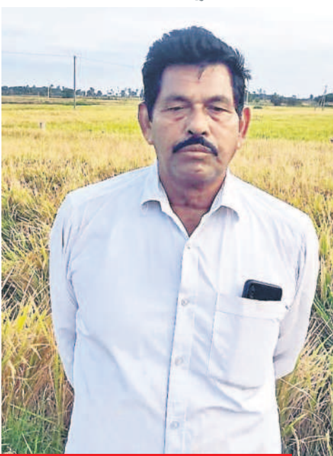
రికార్డులు తారుమారు చేసిన గోస సెడుతరు

ధరణిలో పేరు ఉంటే భూములు కట్టా కావు అన్న భరోసా వచ్చింది. వ్యవసాయ భూములపై పట్టాదారుకు పూర్తి హక్కులుంటాయి. పాస్ పుస్తకాల్లో పేరు ఉంటే వారికి రైతు బంధు కింద బ్యాంకుల్లో సగదు జమ అవుతుంది. ఈ కారణంలో కాంగ్రెస్ నాయకులు రైతులను మోసం చేయాలని చూస్తున్నారు. భూ మాత వస్తే భూ బకాసురులు తయారవుతారు. పట్టాల్లో వ్యవస్థ వస్తే మంచినీళ్లు రికార్డులన్నీ మళ్లీ తారుమారు చేసి రైతులను గోస పెడుతారు. చిన్న కాగితం కావాలన్నా కావాలికాదు మొదలుకొని పట్టాల్లో వరకు అందరికీ సలాంలు కొడుతూ తిరగాల్సి వస్తుంది. లెక్క ముట్ట జెప్పవలసి వస్తుంది. ధరణి తీసివేస్తే భూ సమస్యలు వెరిగి ఎంతో మంచి రైతులందరికీ ఉంటుంది. రైతుల మేలు కోరి బీఆర్ఎస్ తో మా మద్దతు.