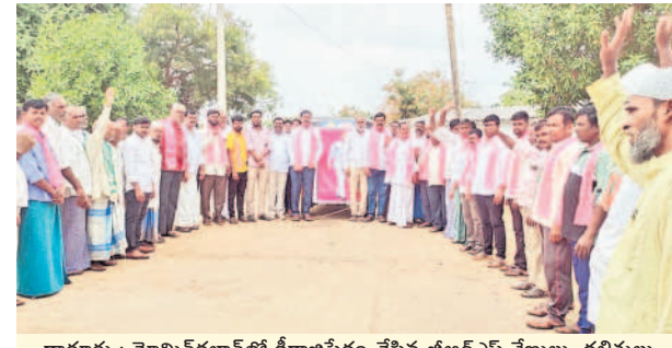
ధారూరు : మోమినకలాన్లో క్షీరాభిషేకం చేసిన బీఆర్ఎస్ శ్రేణులు, దళితులు