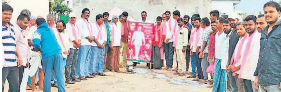
ధారూరులో కేసీఆర్ చిత్రపటానికి క్షీరాభిషేకం చేస్తున్న బీఆర్ఎస్ పార్టీ నాయకులు, దళితులు