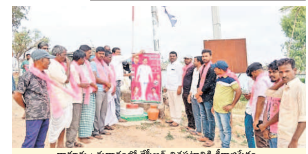
ధారూరు : రుద్దూరులో కేసీఆర్ చిత్రపటానికి క్షీరాభిషేకం..