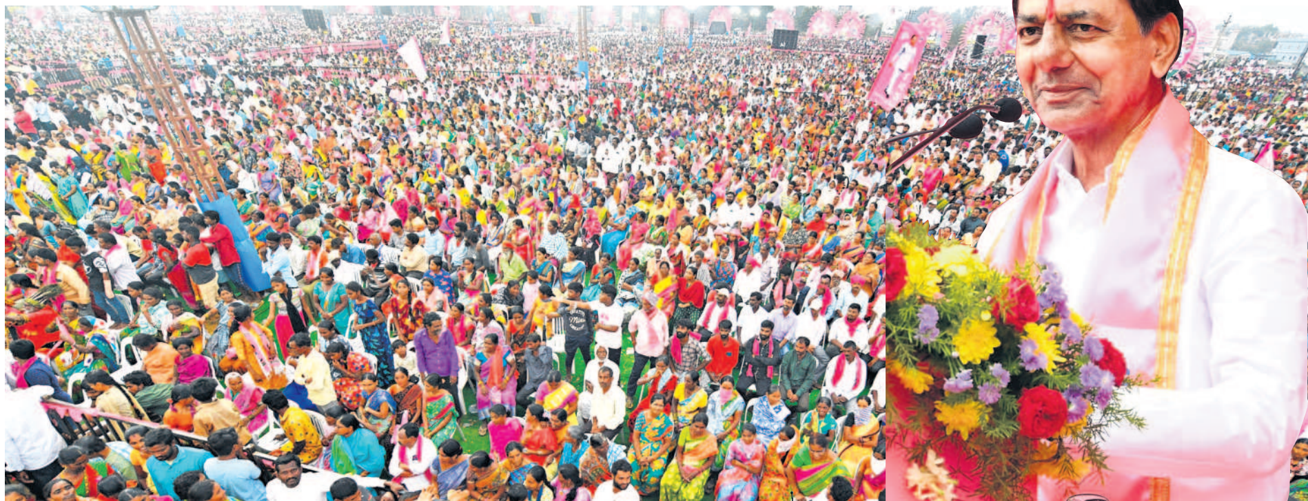
భూపాలపల్లి ప్రజా ఆశీర్వాద సభకు హాజరైన ప్రజలు