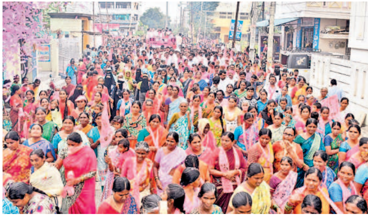
దేశాయిపేటలో పెద్ద ఎత్తున ర్యాలీ నిర్వహిస్తున్న ప్రజలు

న్నాయని ఎద్దేవా చేశారు. ప్రచారానికి వచ్చే కాంగ్రెస్, బీజేపీ నాయకులను తరిమికొట్టాలని ప్రజలను కోరారు. వరంగల్ తూర్పులో బీఆర్ఎస్ గెలుపు ఖాయమైందని ధీమా వ్యక్తం చేశారు. కాంగ్రెస్, బీజేపీలు డిపాజిట్ కోసం కొట్లాడుతున్నాయని ఎద్దేవా చేశారు. పూటకో మాట మార్చే బీజేపీ నాయకుడు.. రేపు ప్రజలను వదిలి ఎక్కడి పోతాడో తెలియని పరిస్థితి ఉందని ఎద్దేవా చేశారు. అనంతరం వివిధ పార్టీలకు చెందిన కార్యకర్తలు, నాయకులు ఎమ్మెల్యే సమక్షంలో బీఆర్ఎస్