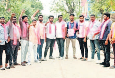
గిర్వాజీపేట: 26వ డివిజన్ లో ప్రచారం చేస్తున్న బీఆర్ఎస్ యూత్ నాయకులు