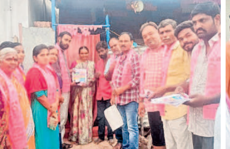
జ్యోతిబసు నగర్ లో ఇంటింటా ప్రచారం నిర్వహిస్తున్న బీఆర్ఎస్ నాయకులు, కార్యకర్తలు