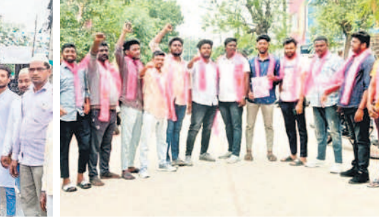
గిర్నాజీపేట: 26వ డివిజన్ లో ప్రచారం చేస్తున్న బీఆర్ఎస్ యూత్ నాయకులు