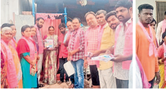
జ్యోతిబసు నగర్ లో ఇంటింటా ప్రచారం నిర్వహిస్తున్న బీఆర్ఎస్ నాయకులు, కార్యకర్తలు