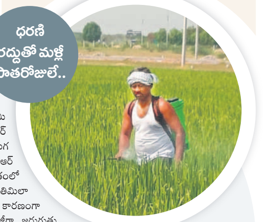
ధరలే రద్దయితే మళ్ళీ పాతరోజులే..