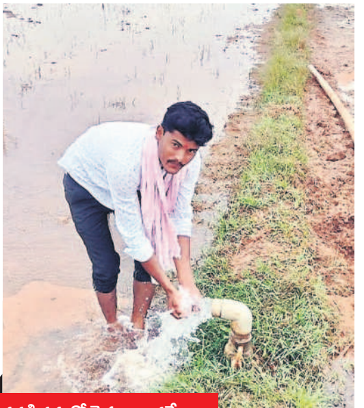
ధరలే రద్దయితే రైతులు ఆగమే..