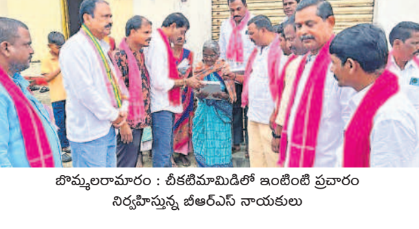
బొమ్మలరామారం : చీకటిమామిడిలో ఇంటింటి ప్రచారం నిర్వహిస్తున్న బీఆర్ఎస్ నాయకులు