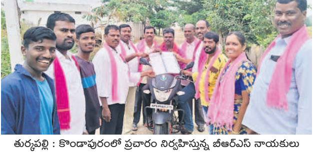
తుర్కపల్లి : కొండాపురంలో ప్రచారం నిర్వహిస్తున్న బీఆర్ఎస్ నాయకులు