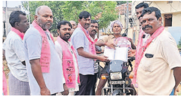
మోటకొండూర్ : చందేపల్లిలో కారు గుర్తు చూపి ఓటు అభ్యర్థిస్తున్న బీఆర్ఎస్ నాయకులు

పోలింగ్ కేంద్రానికి చేరుకున్న తరువాత పరిసరాల పట్ల అవగాహన కలిగిఉండాలని సూచించారు. ఏజెంట్లకు గుర్తింపు కార్డులు ఇవ్వాలని, పోలింగ్ నిబంధనలను తెలియజేయాలన్నారు. అభ్యర్థికి ఒక ఏజెంట్ ను మాత్రమే అనుమతించాలని, పోలింగ్ కేంద్రానికి 100 మీటర్ల లోపు ఎలాంటి ప్రచారాలు చేయకుండా చూసుకోవాలన్నారు. సమావేశంలో ప్రిసైడింగ్, అసిస్టెంట్ ప్రిసైడింగ్ అధికారులు పాల్గొన్నారు.