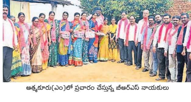
అత్తకూరు(ఎం)లో ప్రచారం చేస్తున్న బీఆర్ఎస్ నాయకులు