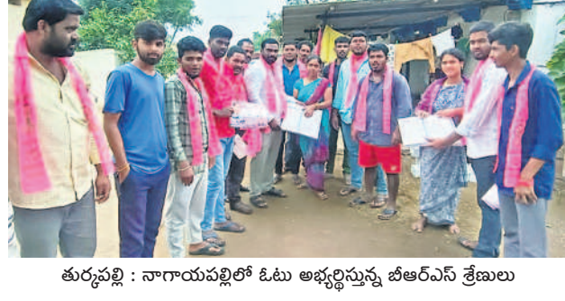
తుర్కపల్లి : నాగాయపల్లిలో ఓటు అభ్యర్థిస్తున్న బీఆర్ఎస్ శ్రేణులు