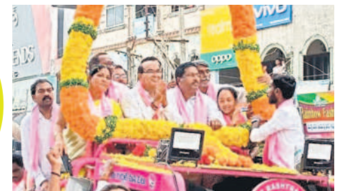
మెచ్చాను గజమాలతో సత్కరిస్తున్న బీఆర్ఎస్ నాయకులు

రైతుబీమాలా పేదలకు అందించాలన్నదే కేసీఆర్ ఆలోచన కేసీఆర్ ను మరోసారి గెలిపిస్తే నూతన మ్యూనిఫెస్టో అమలు అశ్వారావుపేట ప్రచారంలో బీఆర్ఎస్ అభ్యర్థి 'మెచ్చా'