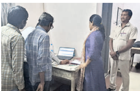
గోదాంను సిబ్బందికి సూచనలిస్తున్న కలెక్టర్ ప్రియాంక ఆల

కొత్తగూడెం టౌన్, నవంబర్ 25: శాసనసభ ఎన్నికల నిర్వహణలో భాగంగా శనివారం జిల్లా ఎన్నికల అధికారి, కలెక్టర్ డాక్టర్ ప్రియాంక ఆల కొత్తగూడెం ఆర్డివో కార్యాలయంలో ఏర్పాటు చేసిన ఈవీఎం గోదాంను పరిశీలించారు. పినపాకకు 68, ఇల్లెందుకు 75, కొత్తగూడెం