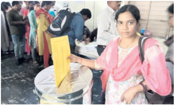
ఓటు హక్కు వినియోగించుకుంటున్న ఎన్నికల సిబ్బంది

కొత్తగూడెం టౌన్, నవంబర్ 25: పోలింగ్ విధులు నిర్వహించనున్న 939 మంది సిబ్బంది ఆయా నియోజకవర్గాల కేంద్రాల్లోని రిటర్నింగ్ అధికారుల కార్యాలయాల్లో ఏర్పాటు చేసిన ఫెసిలిటీస్ కేంద్రాల్లో పోస్టల్ బ్యాలెట్ ద్వారా ఓటు హక్కు వినియోగించుకున్నారని కలెక్టర్ డాక్టర్ ప్రియాంక ఆల తెలిపారు. పినపాక నుంచి 308 మంది, ఇల్లెందు నుంచి 118 మంది, కొత్తగూడెం నుంచి 211 మంది, అశ్వారావుపేట నుంచి 221 మంది, భద్రాచలం నుంచి 81 మంది ఓటు వేశారన్నారు.