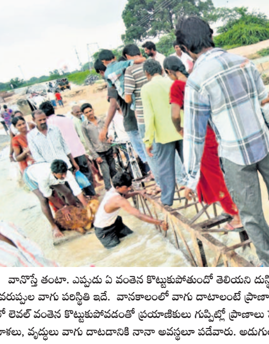
వానోష్టి తండా. ఎప్పుడు ఏ వంతెన కొట్టుకుపోతుందో తెలియని దుస్థితి ఒకప్పటి తెలంగాణది. జనగామ జిల్లా దేవరపల్లె వాగు పరిస్థితి ఇదే. వానకాలంలో వాగు దాటాలంటే ప్రాణాలు పణంగా పెట్టాల్సి వచ్చేది. భారీ వరదలకు లో లెవల్ వంతెన కొట్టుకుపోవడంతో ప్రయాణికులు గుప్పెట్లో ప్రాణాలు పెట్టుకొని అవతలి గట్టుకు చేరేవారు. పిల్లలు, మహిళలు, వృద్ధులు వాగు దాటడానికి నానా అవస్థలూ పడేవారు. అడుగులో అడుగు వేస్తూ భయంతో వడిపోయామారు.