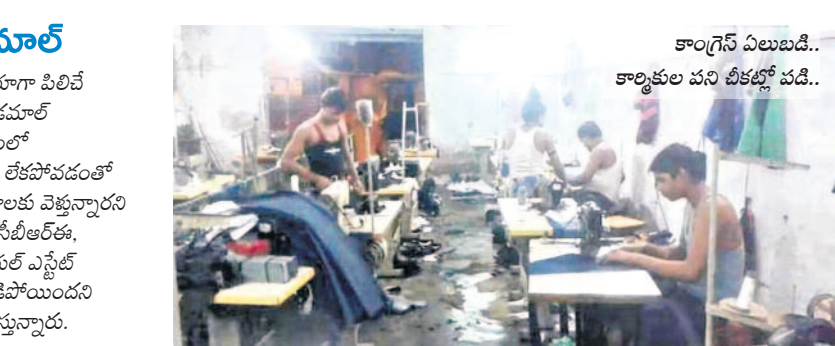
కాంగ్రెస్ విలువబడి.. కాంక్షలకు పని లీకట్లో పడి..

సీలకాన్ వ్యాపి అఫ్ ఇండియాగా పిలిచే బెంగళూరులో రియల్ ఎస్టేట్ ధమాల్ అయ్యింది. కాంగ్రెస్ అసమ్మర్ష విధానాలు, ప్రభుత్వంలో పేరుకుపోయిన అవినీతి, పాలన అమలులో వేగం లేకపోవడంతో కానుగోలురారులు, పారిశ్రామికవేత్తలు ఇతర నగరాలకు వెళ్తున్నారని స్థిరాస్తి రంగ నిపుణులు విశ్లేషిస్తున్నారు. వెస్ట్ యన్, సీబీఆర్ఓ, కుప్పన్ అండ్ వెక్స్ట్, ఆనర్స్ వంటి ప్రఖ్యాత రియల్ ఎస్టేట్ సంస్థల నివేదికలు బెంగళూరులో రియల్ ఎస్టేట్ పడిపోయిందని పేర్కొన్న విషయాన్ని బెంగళూరు రియల్టర్లు ఊహిస్తున్నారు.