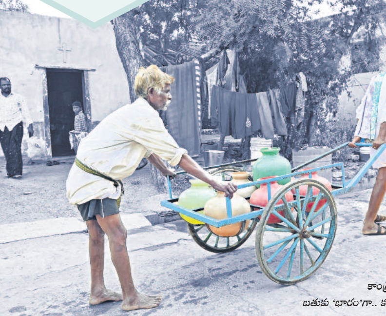
కాంగ్రెస్కు అధికారం.. బతుకు 'భారం'గా.. కన్నీళ్లమయంగా..