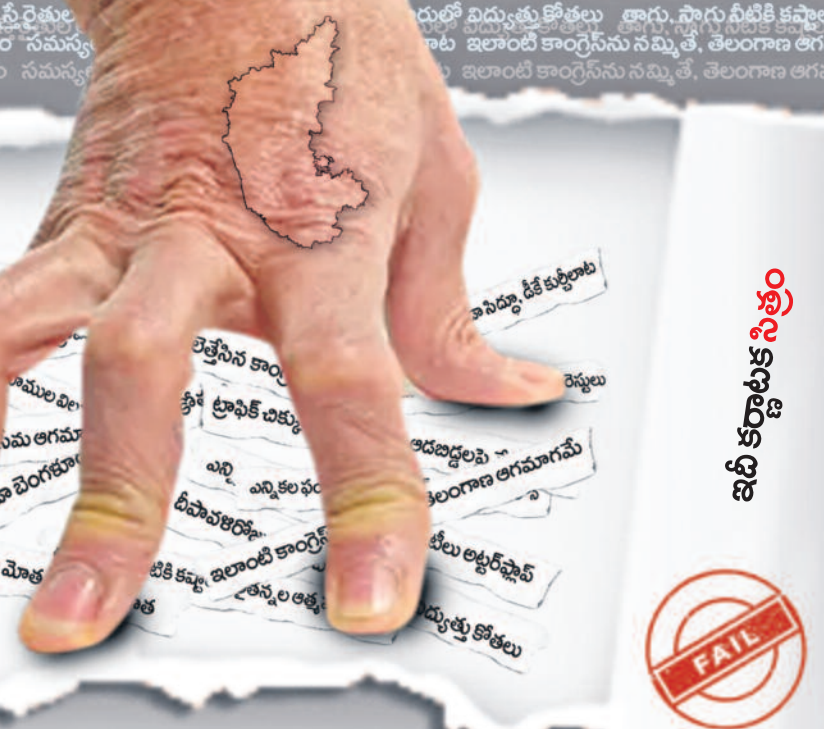
ఇప్పటికే సత్తా ఇవ్వకపోతే... ఫెయిల్