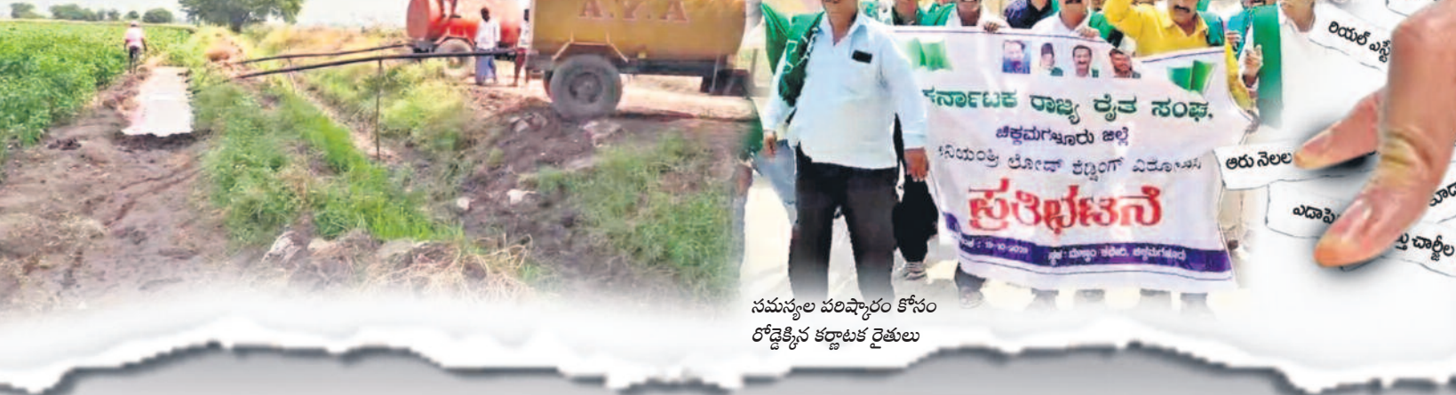
నమస్కల పరిష్కారం కోసం రోడ్లెత్తిన కర్ణాటక రైతులు

కాంగ్రెస్కు ఓటేసినందుకు కర్ణాటక రైతులు పడుతున్న తీవ్రతలకు నిద్రలేపే దృశ్యం