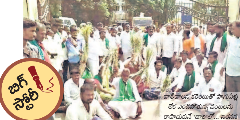
పాలిశాలను కరెంటుకోసం సాగునీరు తోక ఎండిపోతున్న పంటలను కాపాడుకునే 'దాల'లో.. నిరసన

సామాన్య జనాభాలో రాష్ట్ర ప్రజానీకం ఇబ్బందులు పడుతుంటే అధికార కాంగ్రెస్ పార్టీలో మాత్రం అధిపత్య పోరు తాండ్రాయికి చేరింది. సిద్ధరామయ్యను సీఎం.. డిప్యూటీ సీఎం డీకే శివకుమార్ పైకి స్థాపించినప్పటికీ, లోలోన అసంతృప్తితో రగిలిపోతున్నారు. ఈ వ్యవహారం క్యాంపు రాజకీయాల వరకు వెళ్లింది. డీంట్ ఎప్పుడు ఎవరు తిరుగుబాటు చేస్తారు? ఎప్పుడు ప్రభుత్వం కూలిపోతుంది? ఆలోచన పరిస్థితులు దిగజారాయి. సీనియర్ మంత్రి సతీష్ జార్జిహోళి వంటి మరెవరైనా మంది నేతలు కూడా సీఎం రేసులోకి వస్తున్నారు.