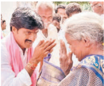
వెంకటాపురంలో ఓటు అభ్యర్థిస్తున్న విజయుడు