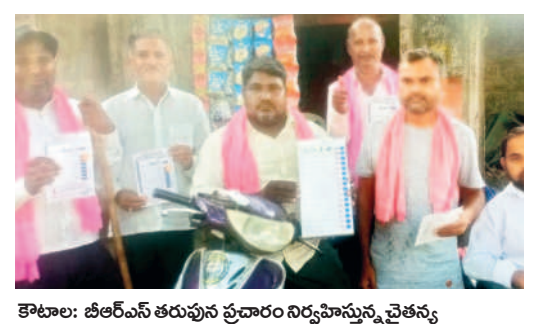
కొటాల: బీఆర్ఎస్ తరుపున ప్రచారం నిర్వహిస్తున్న చైతన్య దివ్యాంగుల సంఘం నాయకులు