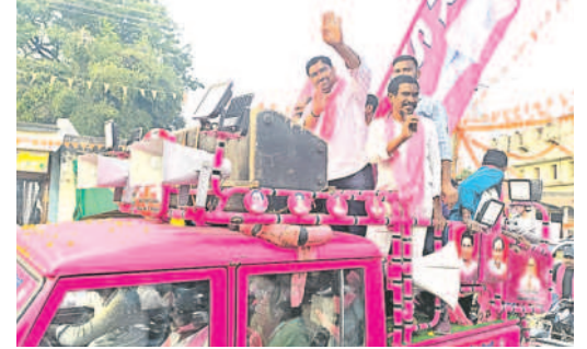
సిర్పూర్ (టీ): ప్రజలకు అభివృద్ధి చేస్తున్న కోనేరు వంశీ