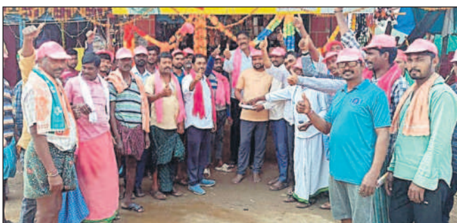
బారెగూడలో ప్రచారం నిర్వహిస్తున్న బీఆర్ఎస్ నాయకులు