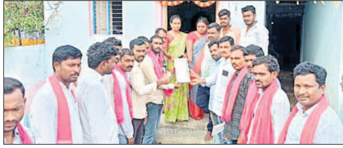
పెంచికల్ పేట్ : ఎల్లూరులో ఇంటింటా ప్రచారం నిర్వహిస్తున్న బీఆర్ఎస్ నాయకులు