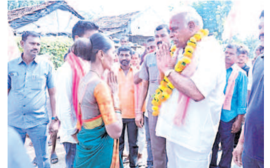
కొటాల: గుడ్లబోరి గ్రామంలో పూలమాల వేసి ప్రచార ర్యాలీకి స్వాగతం పలుకుతున్న గ్రామస్థులు