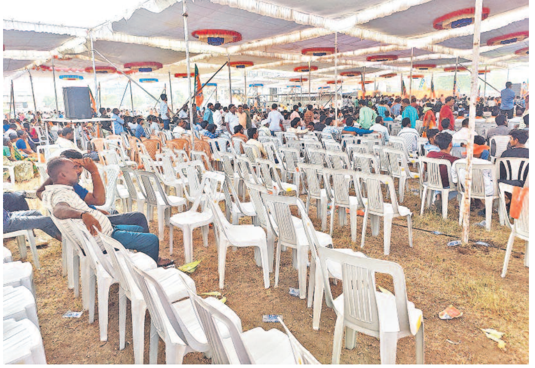
రాజన్న సిరిసిల్ల జిల్లా వేములవాడలో నిర్వహించిన బీజేపీ సకల జనుల విజయ సంకల్ప సభలో ఖాళీగా కనిపిస్తున్న కుర్చీలు. ఉత్తరప్రదేశ్ ముఖ్యమంత్రి యోగి అదిత్యానాథ్ ప్రసంగం అర్ధంకాక వచ్చిన కొంతమంది కూడా మధ్యలోనే మాయమయ్యారు.

మందితో నిర్వహించాలని భావించినా సభ ప్రారంభమైన పది నిమిషాలకే సగానికిపైగా ప్రాంగణం ఖాళీ అయింది. విజయసంకల్ప యాత్రలో భాగంగా సంగారెడ్డి జిల్లా పటాన్ చెరులో బీజేపీ నిర్వహించిన బహిరంగ సభ మొక్కుబడిగా జరిగింది. పట్టణంలోని వ్యవ సాయ మార్కెట్ యాధిక్య ప్రాంగణంలో ఈ సభకు కేంద్ర హోంమంత్రి అమిత్ షా హాజరైతే జనం ఆదరించలేదు. ఈ సభ వస్తు పాటి నడకను తలపించడంతో కాషాయ పార్టీ నేతలు తలలు పట్టుకున్నారు. కామా రెడ్డి నియోజకవర్గంలో శనివారం ఎన్నికల ప్రచారానికి వచ్చిన ప్రధాని నరేంద్రమోదీ సభ కూడా తూతూమంత్రంగా సాగింది. ఆత్మస్తుతి, పరనింద అన్నట్లుగా ప్రసంగం సాగడంతో జనం ఆసక్తి చూపలేదు.