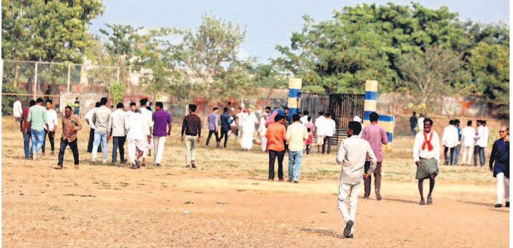
ఆదిలాబాద్ నియోజకవర్గ ప్రచార సభలో రాహుల్ గాంధీ ప్రసంగిస్తుండగానే వెళ్లిపోతున్న ప్రజలు