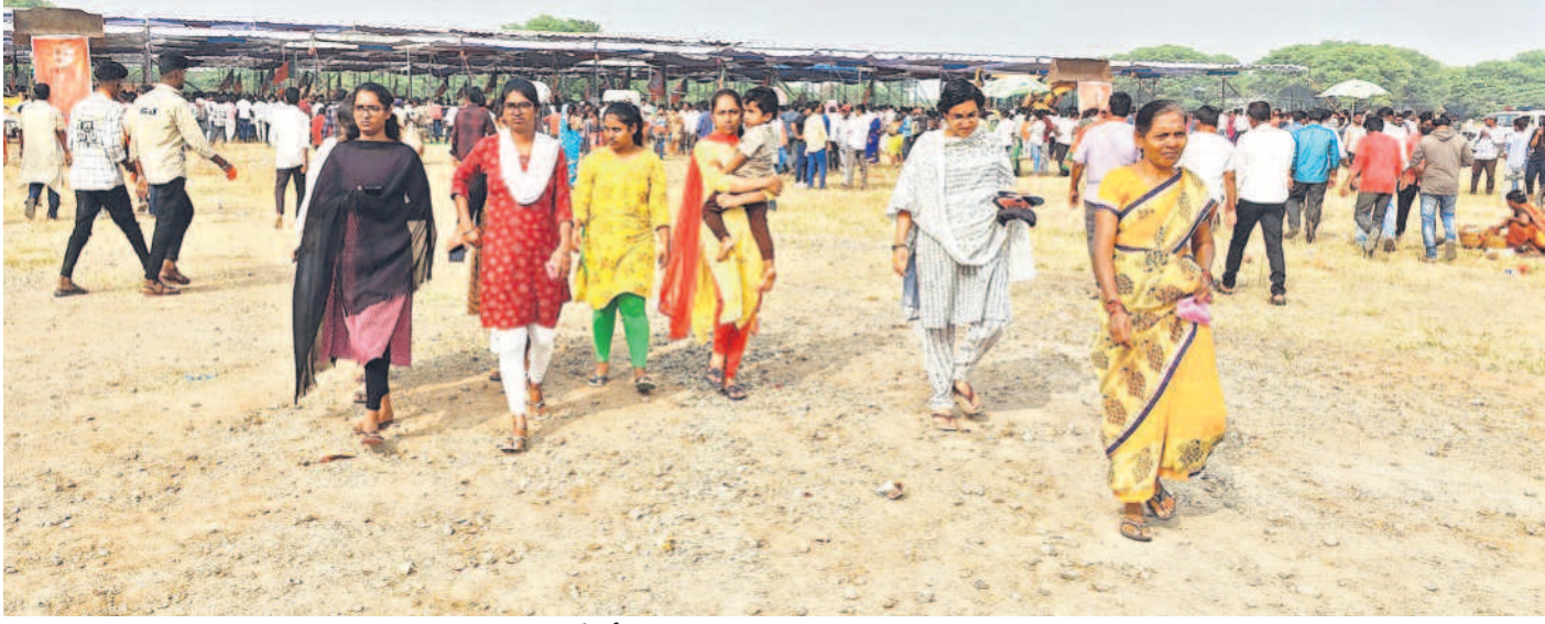
రాజన్న సిరిసిల్ల జిల్లా వేములవాడలో బీజేపీ సకలజనుల విజయ సంకల్ప సభ ప్రారంభంకాగానే తిరిగి వెళ్లిపోతున్న మహిళలు