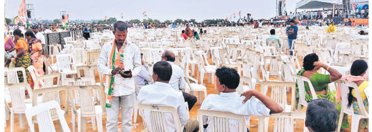
శనివారం రంగారెడ్డి జిల్లా షాద్ నగర్ పట్టణంలో నిర్వహించిన కాంగ్రెస్ సభలో జనం లేక ఖాళీగా దర్శనమిస్తున్న కుర్చీలు