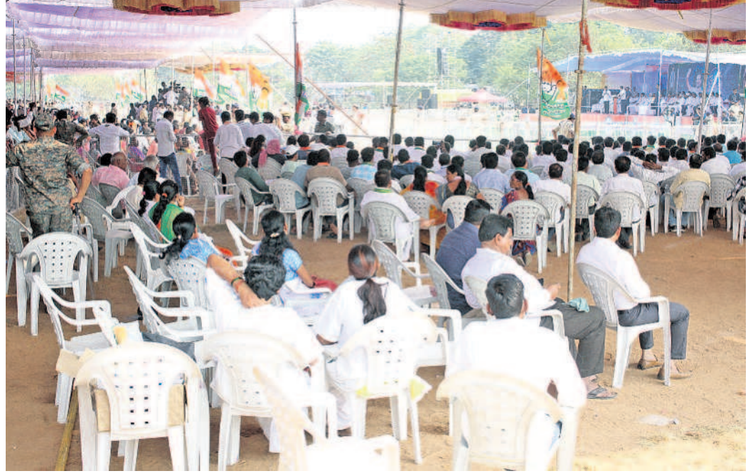
శనివారం ఆదిలాబాద్ నియోజకవర్గ సభలో కాంగ్రెస్ నేత రాహుల్ గాంధీ ప్రసంగిస్తుండగా జనంలేక వెలితిగా కనిపించిన ప్రాంగణం

బమ్మం జిల్లాలో శనివారం ఏపిసీ ప్రధాన కార్యదర్శి ప్రియాంకగాంధీ నిర్వహించిన రోడ్ షో, బహిరంగ సభలు అట్టర్ ఫ్లాప్ అయ్యాయి. నగరంలోని జిల్లా పరిషత్ సెంటర్ నుంచి వరంగల్ క్రాసింగ్ వరకు సాగిన రోడ్ షో వేలవంగా సాగింది. జనం లేకపోవడంతో రోడ్ షోలో ఆమె ఒక్క మాట కూడా మాట్లాడలేదు. మధిర బహిరంగ సభలోనూ ఆమెకు ఇలాంటి పరిస్థితే ఎదురైంది. ప్రియాంక ప్రసంగం పూర్తికాక ముందే జనం ఇంటిదారి పట్టారు. నిజామాబాద్ జిల్లా బోధన్ శివారులోని సర్కూలర్ గేట్ వద్ద రాహుల్ గాంధీ నిర్వహించిన 'విజయభేరి' సభ కూడా వెలవెలబోయింది. సభ ప్రాంగణంలో ఖాళీ కుర్చీలు దర్శనమిచ్చాయి. సరిగ్గా పదిరోజుల క్రితం జడే స్టలంలో సీఎం కేసీఆర్ నిర్వహించిన ప్రజాఆశీర్వాద సభకు ఇసుకేస్తే రాలనంత జనం వచ్చారు. ఆది లాబాద్లోనూ రాహుల్ కు చేతులు అనుభవమే మిగిలింది. రాహుల్ ప్రియాంక అర్ధం కాకపోవడంతో జనం మధ్యలోనే లేచిపోయారు. రంగారెడ్డి జిల్లాలో శనివారం రెండుచోట్ల బహిరంగ సభలు, ఒకచోట కార్పర్ మీటింగ్ జరగగా, ఆమెనగల్ బహిరంగ సభకు ఏపిసీ చీఫ్ మల్లికార్జునఖర్, పీసీసీ అధ్యక్షుడు రేవంత్ రెడ్డి హాజరవుతుంటే జనం నుంచి స్పందన కరువైంది. మాడుచోట్ల సభలు ప్లాప్ అయ్యాయి. ఆమెనగల్ సభలో వచ్చిన జనం కూడా మధ్యలోనే లేచిపోయారు. నేతలు బతిమాలుతూ ప్రయోజనం లేకపోయింది. షాద్ నగర్ సభకు రేవంత్ దుమ్మా కొట్టడం చర్చనీయాంశమైంది. ఆశీర్ విన స్టాయిల్ ప్రజలు రాకపోవడం వల్లే రేవంత్ దుమ్మాకొట్టినట్లు ప్రచారం జరుగుతు నేతలు చెప్పింది ఆసక్తిగా వింటున్నారు.