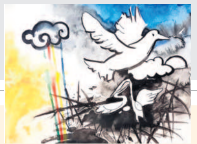
కోటి గళాల కలాపాలు భిన్నస్వరాల వేనవల సుస్వరాలుగా అధికారమధ్యించే ఆరాటంలో జనాల్ని వెద్రెత్తించే ప్రసంగాల ప్రలోభాలు

దశాబ్దాల ప్రజల్ని కన్నెత్తివదలని నిర్ణయనామకత్వం నేడు ప్రత్యక్షమై వచ్చిస్తున్న ప్రబోధం 'నాకోసం కాదు - మీకోసం' ఎన్నికల్లోనే స్పృహించిన జీవన వేదం