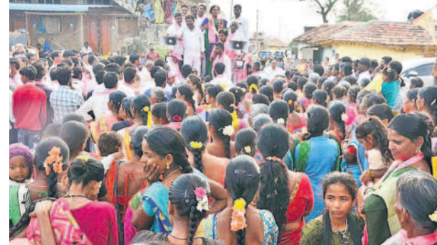
హవేళీఘనపూర్ మండలం నాగాపూర్లో ప్రచారంలో మహిళలు, నాయకులు