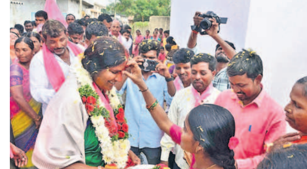
హవేళీఘనపూర్ గ్రామంలో మంగళ హారతులు, సన్మానాలతో బొట్టు పెట్టి స్వాగతం