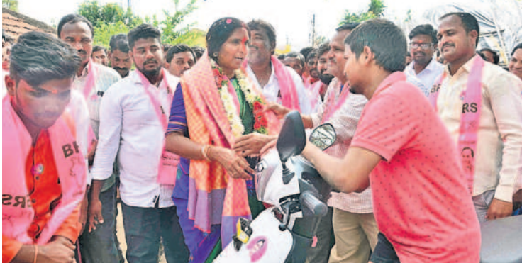
హవేళీఘనపూర్ గ్రామంలో పద్మాదేవేందర్ రెడ్డికి సన్మానాలతో స్వాగతం పలుకుతున్న గ్రామస్థులు

బీఆర్ఎస్ ఎమ్మెల్యే అభ్యర్థి పద్మాదేవేందర్ రెడ్డి ఆధ్వర్యంలో పేరురూలో కాంగ్రెస్, బీజేపీ కార్యకర్తలకు చేరారు. వారికి బీఆర్ఎస్ కండువా కప్పి